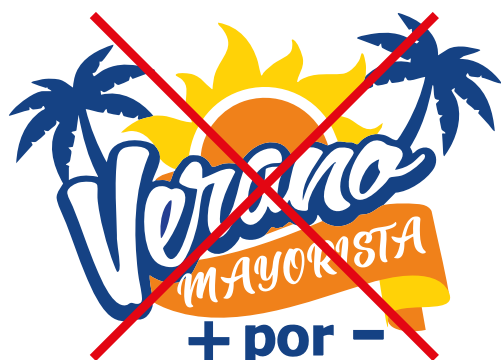
Cambio de tipografía