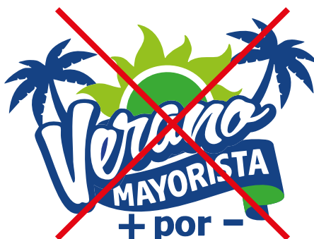
Cambio en los colores