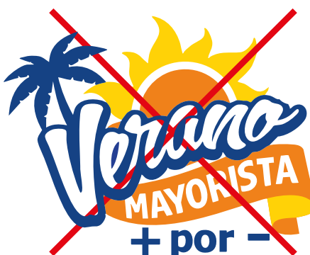
Eliminación de elementos