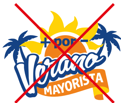
Variación del diseño

No se permiten variaciones en el logotipo de color, posición, elementos o distribución